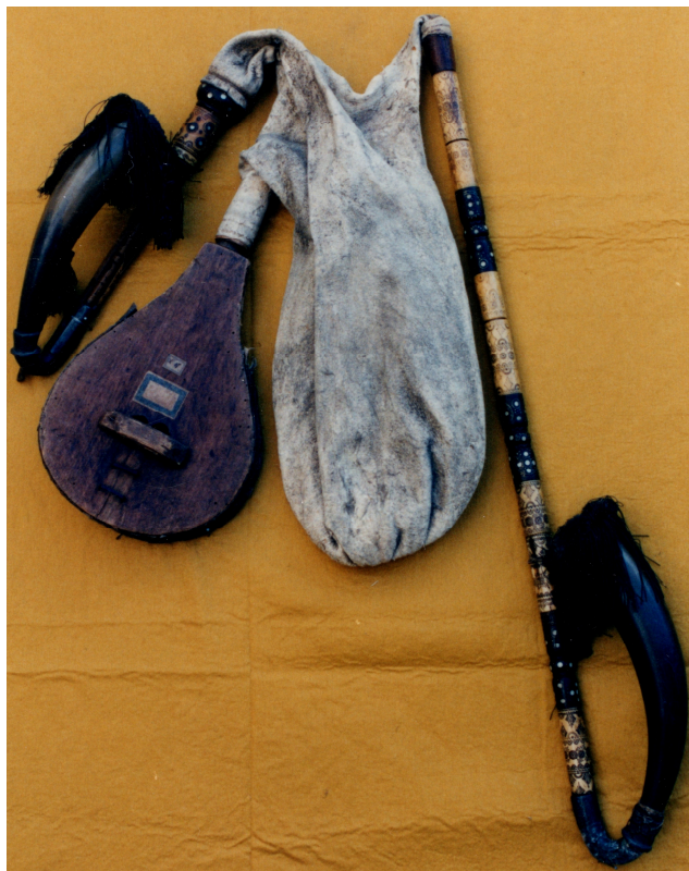
Dudy/gajdy 59/88/258 N z Ořechoviček.

Poznámka redakce Ořechovského zpravodaje: Na festivalu Letní hraní v Ořechově, který se bude konat dne 5. srpna 2017, budou ořechovské gajdy představeny.